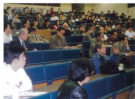
大阪医大セミナー

また、勉強会として毎週木曜日には興味ある話題提供や特別講義などの「大阪医大オープンカンファレンス」を、春と秋には「大阪医大セミナー」も開催しておりますので、どうぞお越し下さい。今後ともどうぞよろしくお願い申し上げます。