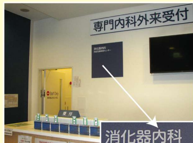
消化器内科 炎症性腸疾患センター

ることを目的として、「炎症性腸疾患センター (IBDセンター)」を標榜することといたしました。お困りの症例は遠慮なくご紹介ください。どうぞよろしくお願い申し上げます。