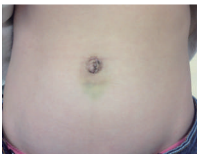
(写真1) 卵巢嚢腫の摘除術2週間後の状態。臍内を縦切開した。

小児外科領域でも成人同様に内視鏡手術が拡がりつつあります。当科では女兒の卵巢嚢腫や急性虫垂炎に対しては特に臍部のみのポートで行う単孔式腹腔鏡を行っています。術後は創が臍内に隠れ、満足いく外観が得られます（写真1）。小さな創部で美容的な効果のみならず術後の疼痛や癒着などの合併症の減少にも寄与することから今後積極的に導入していく予定です。