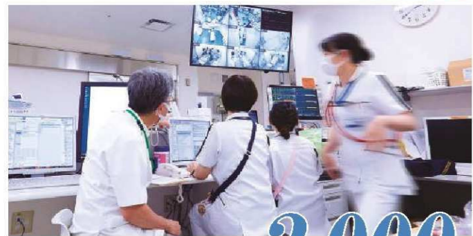
二次・三次の中間病態を含め年間対応数 2,000 件見込