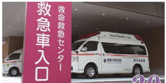
ドクターカー出動（日勤帯のみの運用）平均 30 回/月