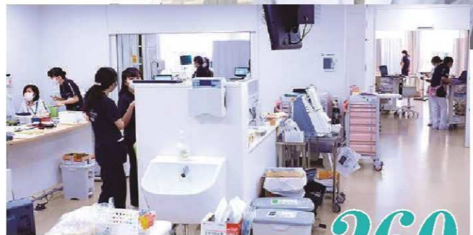
コロナ重症患者受入実績 260 件以上