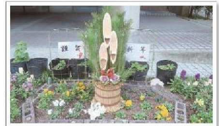
当院ポフンティアグループ「ふれあい」が毎年製作しています。

※三島南病院は休診のため、シャトルバス (大阪医薬大病院⇄三島南病院) 運休です。