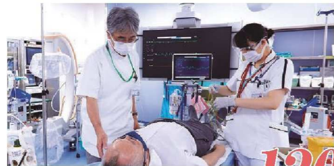
発足後1ヶ月救命救急搬送用ホットライン約 120 件

三島医療圏の救急医療の「最後の砦」として、あらゆる救急医療に対応する救命救急センターが新しく設置されました。新本館A棟1階の大部分が初療フロアで、三次救急対応のCT室に直結した蘇生・手術室2室、さらに二次救急初療エリアがあります。3階の救命救急専用ICUへは直通エレベーターで連結され、初療からシームレスな診療を行います。