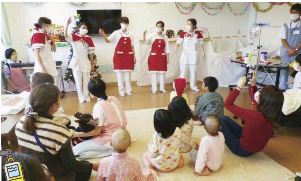
小児病棟 クリスマス会の風景