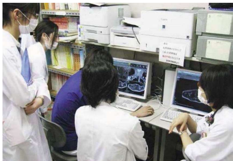
膠原病グループカンファレンス風景