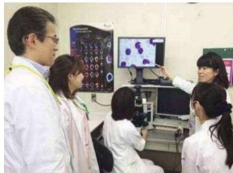
血液・腫瘍グループカンファレンス風景