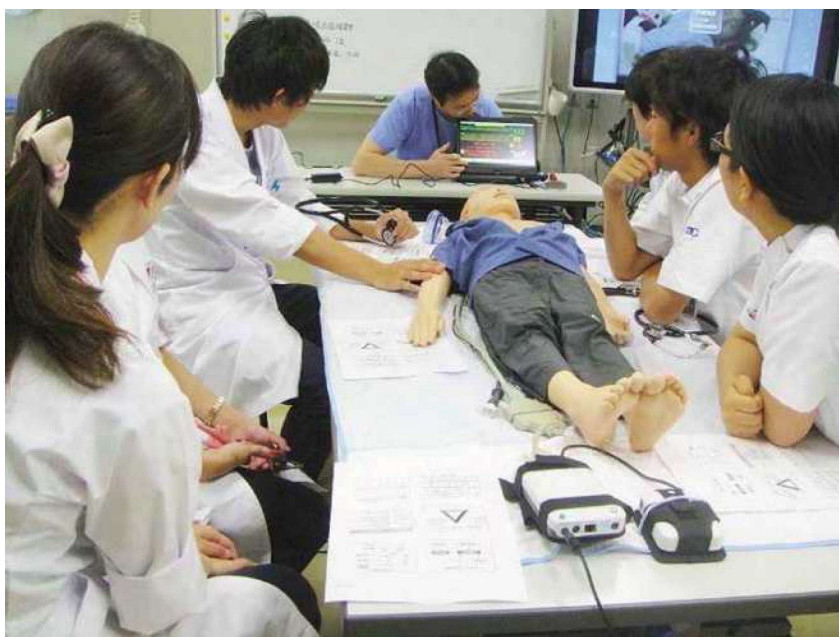
小児科 Simulation トレーニング風景