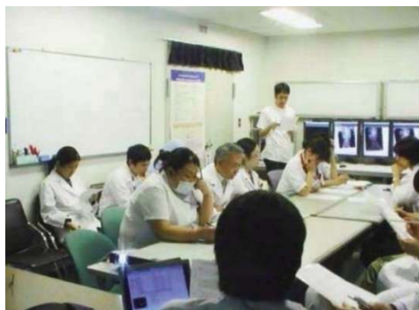
小児循環器合同カンファレンス風景