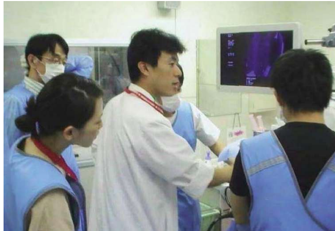
消化器内視鏡検査