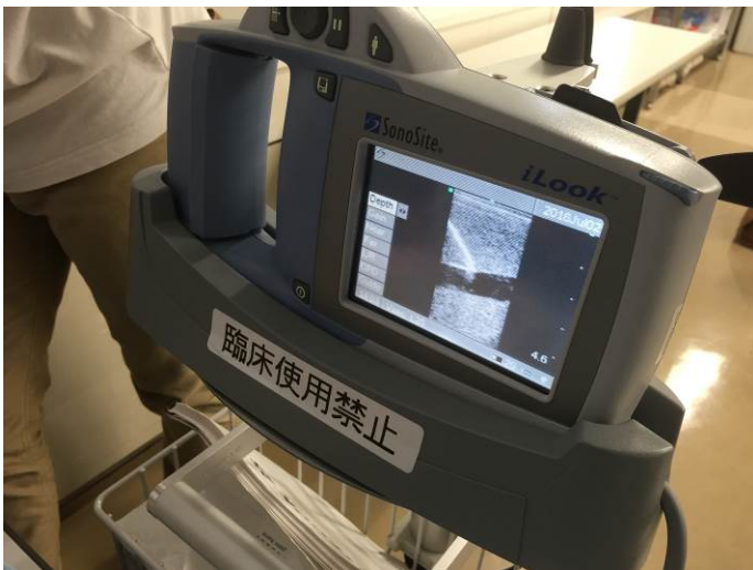
中心静脈穿刺の合併症とその対応に関するディスカッション