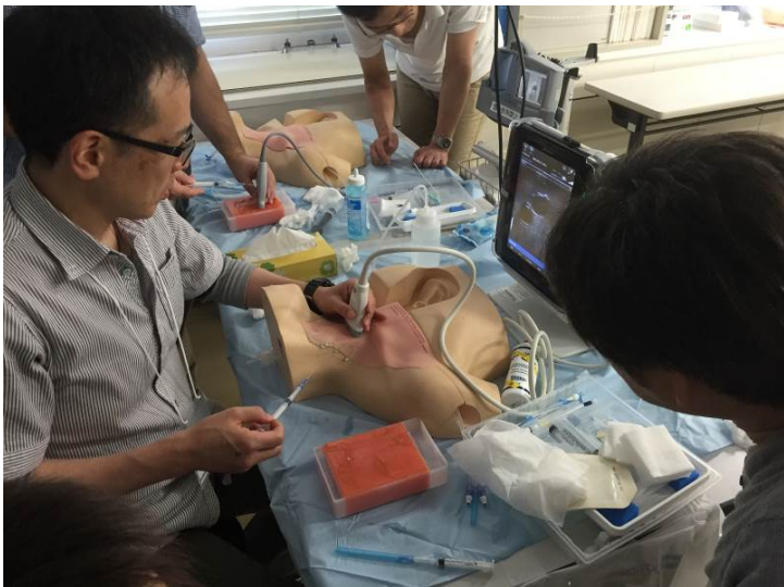
ニードルガイドによる長軸描出